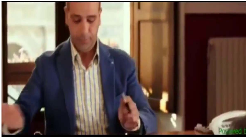
Quo vado? (2016)

Dal Segretario «esecutivo» al Manager Didattico per la Qualità che si occupa in prima persona della reingegnerizzazione dei processi